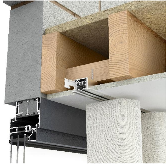
リセスレール + カーテントラック + ウェッジ